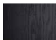
Laqué noir (RAL 9011)