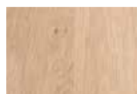
Teinté naturel blanc