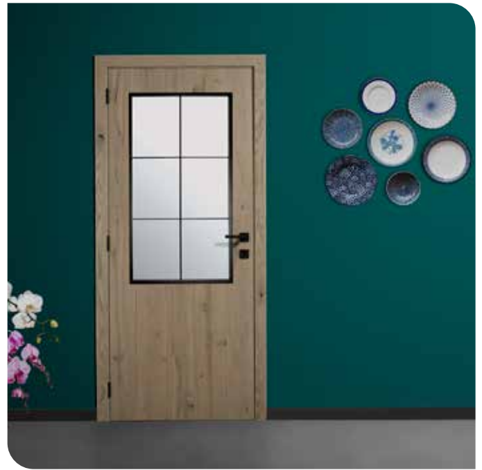
Portes parquet chêne barnwood