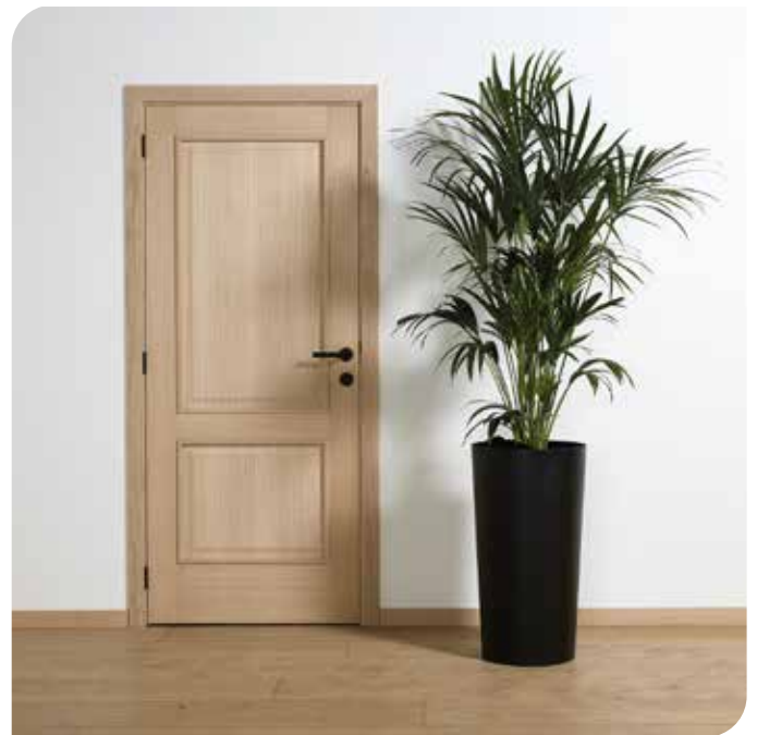
Portes Proma chêne economica