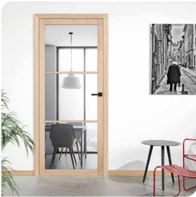
Portes SLK chêne

Outre les portes rurales la gamme de portes comprend un nombre d'autres séries! Ci-dessous un extrait de la collection :