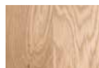
Huile naturel blanc